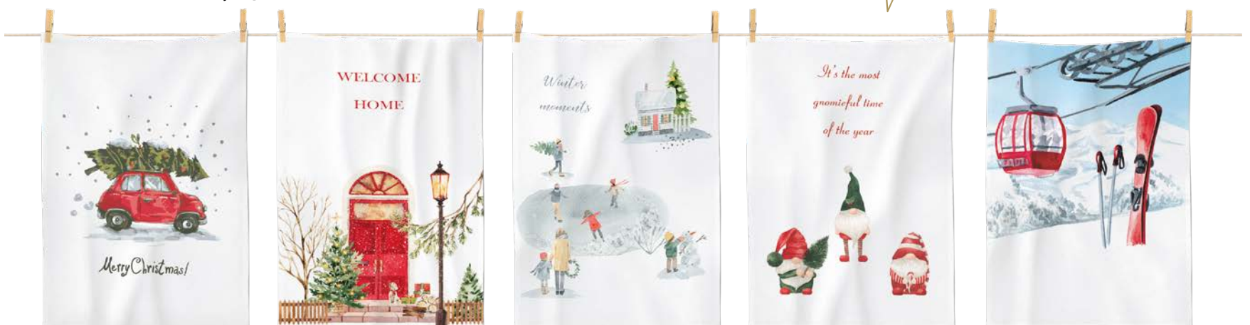
3. GESCHIRRTÜCHER je 6,95

1. BIBER-BETTWÄSCHE: Angenehm wärmend, weich zur Haut und außergewöhnlich im Dessin. Passend zur Jahreszeit bedruckt mit verspielten winterlichen Motiven. Aus 100 % Baumwolle. Mit Reißverschluss. 135 / 200 cm 49,95, 155 / 220 cm 59,95. 2. FLANELL-BETTWÄSCHE: Gemütlicher geht's nicht. Hübsches Karomuster in warmen Farben und kuschelweicher Flanellqualität bringt Entspannung und Wohlfühlatmosphäre ins Bett. Aus 100 % Baumwolle. Mit Reißverschluss. 135 / 200 cm 69,95, 155 / 220 cm 89,95. 3. GESCHIRRTÜCHER: Vielseitige Küchenhelfer, die optische Akzente setzen. Schön praktisch und saugfähig in fünf süßen, vom Winter inspirierten Dessins. Aus 100 % Baumwolle. 50 / 70 cm je 6,95. 4. DAMEN-PYJAMA: Bequeme Begleitung für kühle Nächte und fast zu schön, um nur darin zu schlafen. Geschmeidige, atmungsaktive Jersey-Qualität in vier bezaubernden Varianten. Aus 100 % Baumwolle. Größen: S bis XL je 29,95.