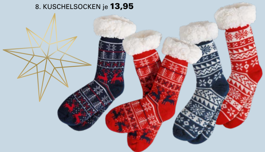
8. KUSCHELSTOCKEN je 13,95

5. HERREN-PYJAMAHOSE: Eine Wohltat fürs Auge, angenehm auf der Haut und – kombiniert mit einem bequemen Oberteil – das Wohlfühl-Outfit für die Nacht. Jersey-Qualität in vier unterschiedlichen Dessins. Aus 100 % Baumwolle. Größen: M bis XXL je 19,95. 6. KUNSTFELL-DECKE: Die kuscheligste Versuchung, seit es Decken gibt. Superflauschig und außergewöhnlich voluminös. Durch die markante Hoch-Tief-Struktur ein echter Eyecatcher, der Sofaabende zum Wohlfühlerlebnis macht. Rückseite mit weicher Microfaser. Aus 100 % Polyester. 150 / 200 cm 129,-. 7. NACKENSTÜTZKISSEN DORMABELL CERVICAL: Softiges, zweiteiliges Latexkissen zur perfekten Druckverteilung. Mit atmungsaktivem Bezugsstoff, durch Reißverschluss abnehmbar und bei 60 °C waschbar. Preisbeispiel: NB 4 139,95. 8. KUSCHELSTOCKEN: Hübsch gemustert und wunderbar wärmend. Die wohltuende Alternative zu kalten Füßen. Mit Anti-Rutsch-Noppen. Aus 100 % Polyester. One Size je 13,95.