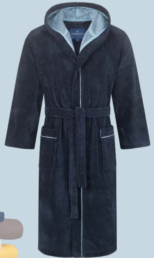
7. HERREN-BADEMANTEL 109,95