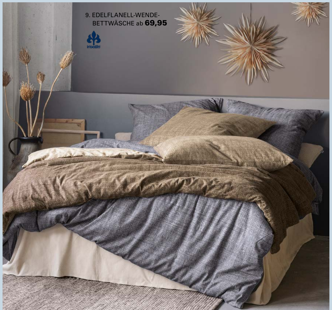
9. EDELFLANELL-WENDE- BETTWÄSCHE ab 69,95