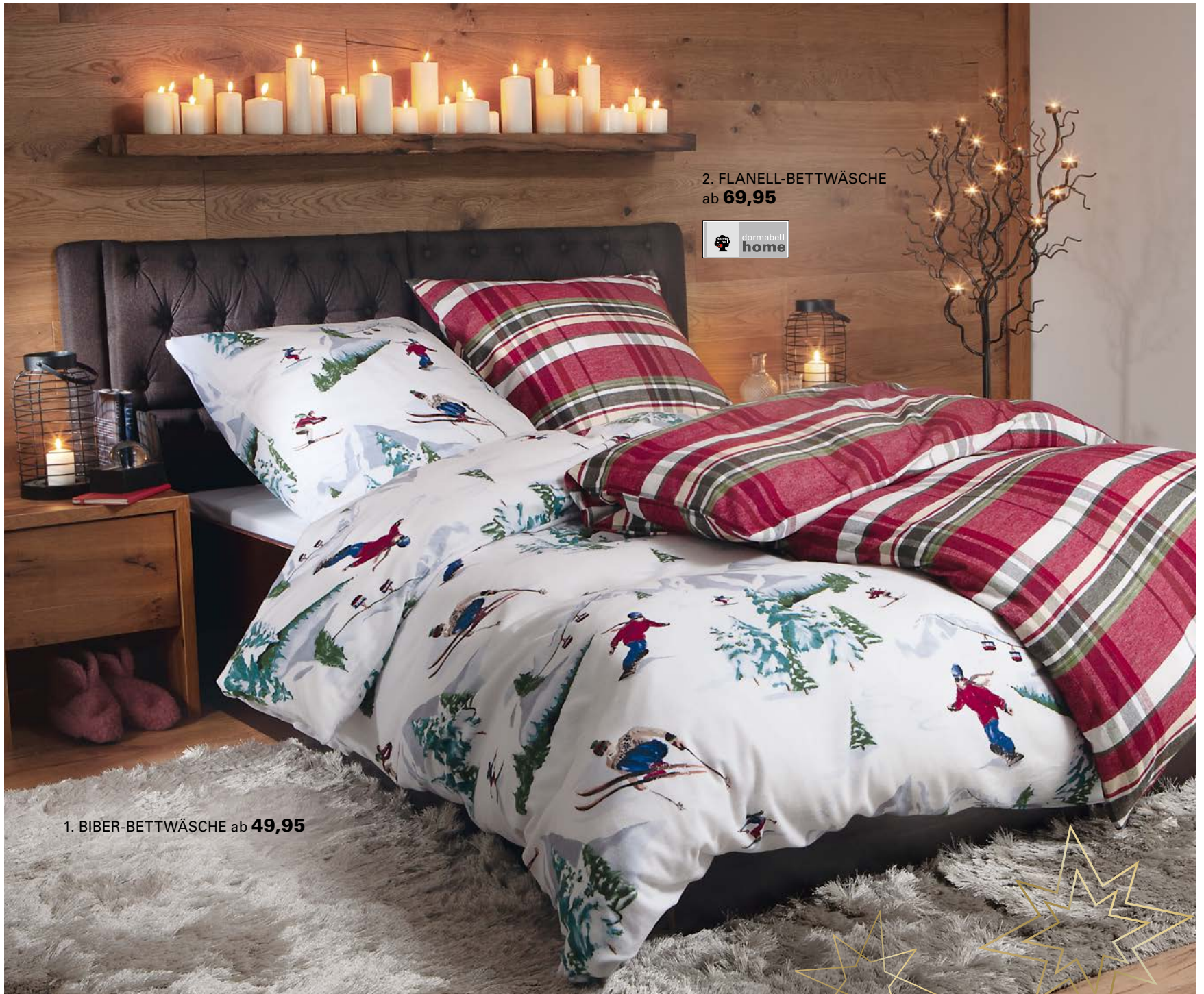
2. FLANELL-BETTWÄSCHE ab 69,95