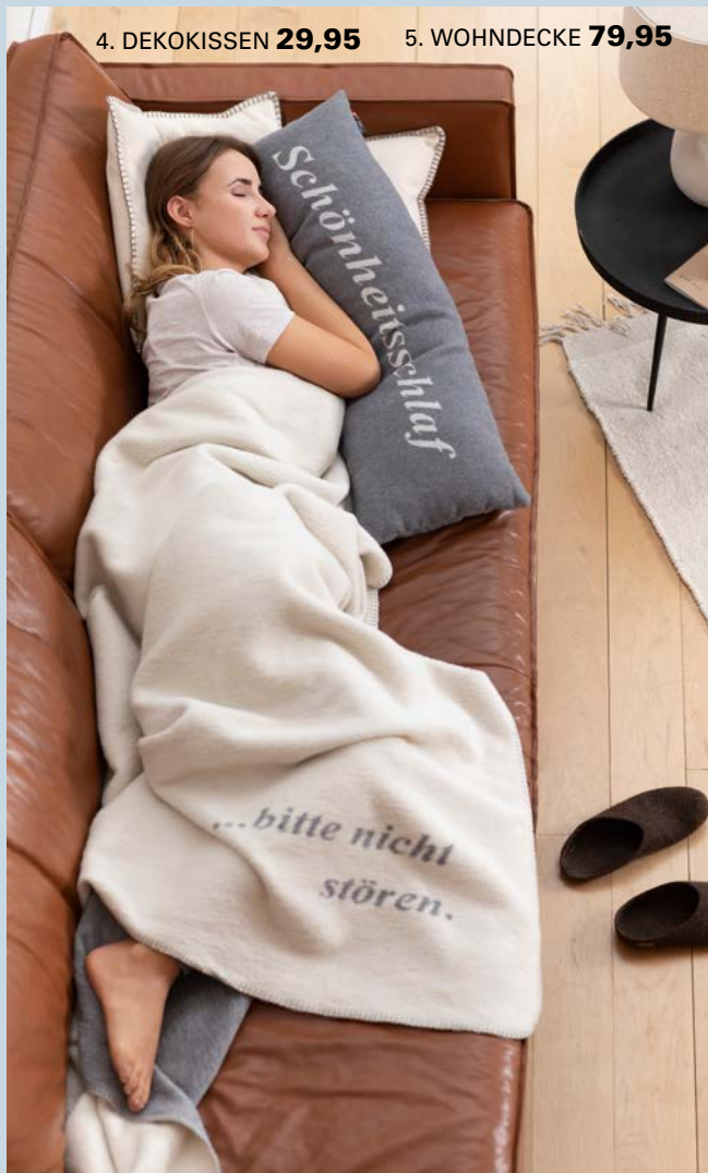
4. DEKOKISSEN 29,95 5. WOHNDECKE 79,95